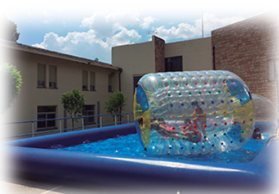
Rulo acuático (3x2m).