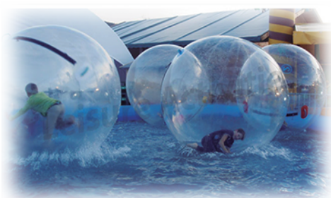
Waterball (2m diámetro esfera).